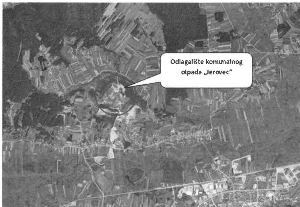
Slika 1. Položaj odlagališta „Jerovec“ u odnosu na okolna naselja

Slike 1 i 2 prikazuju smještaj odlagališta otpada „Jerovec“ i smještaj pripadajućih plinskih bunara.