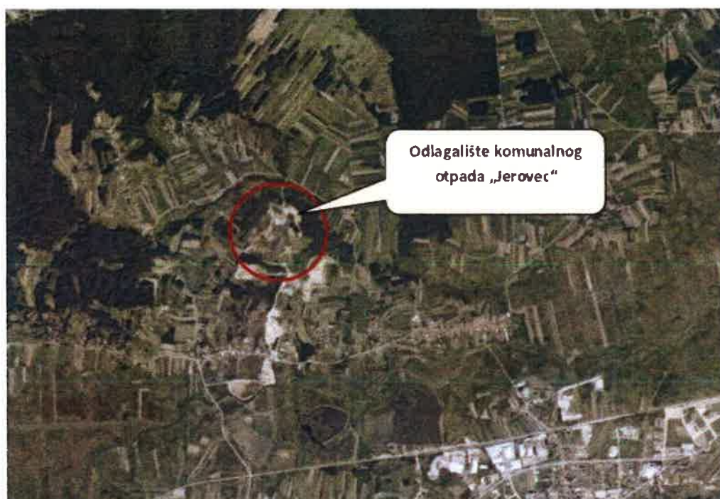
Slika 1. Položaj odlagališta „Jerovec“ u odnosu na okolna naselja

Slike 1 i 2 prikazuju smještaj odlagališta otpada „Jerovec“ i smještaj pripadajućih plinskih bunara.